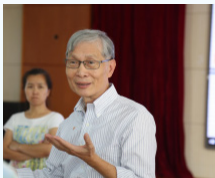
黄显华 教授 香港中文大学教育学院