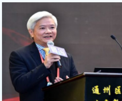
吴浩明 教授 前香港大学教育领导研究中心主任、 西北师范大学教师教育学院外聘教授